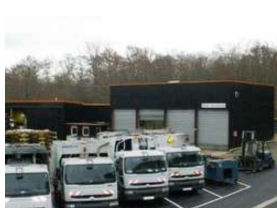
Atelier de Maintenance