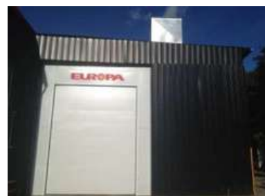
Cabine de peinture