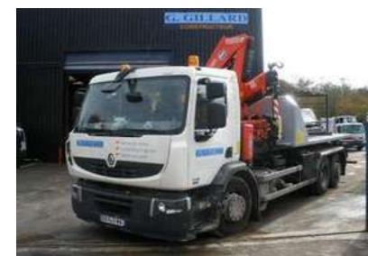
Camion à bras