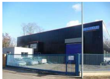
Atelier de Chaudronnerie