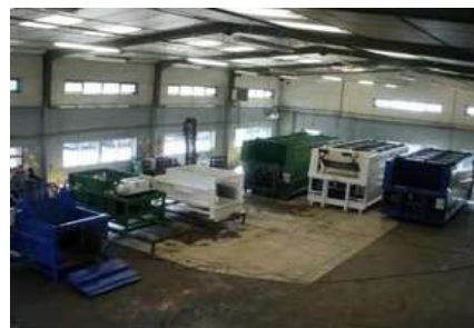
Atelier de Montage