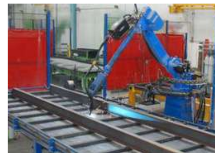
Robot de soudure