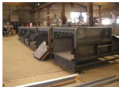
Atelier de Chaudronnerie